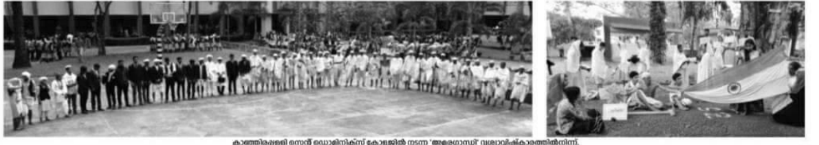
കാഞ്ഞിരപ്പള്ളി സെന്റ് ഡൊമിനിക്കസ് കോളജിൽ നടന്ന 'അമരഗാന്ധി' സ്മരണാപരിപാടിയിൽ നിന്ന്.