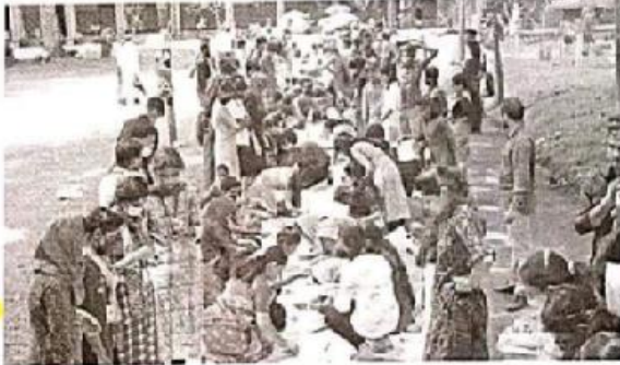
കാഞ്ഞിരപ്പള്ളി സ്വാതന്ത്ര്യ സമര ചരിത്രത്തിന്റെ 75 ഇതിവൃത്തങ്ങളെ ചിത്രീകരിക്കാനായി 'ഹസാർ ഹാഥ്' എന്ന പേരിൽ ഈ ചരിത്രകാവ്യം രചിക്കപ്പെട്ടു. ഇതിൽ 1000 പേർ പങ്കെടുത്തു.

ഈ കലാരചനയിൽ 1000 പേർ പങ്കെടുത്തു. ഈ കലാരചനയിൽ സ്വാതന്ത്ര്യ സമരയുദ്ധത്തിന്റെ ചിത്രീകരണത്തിന് പ്രാധാന്യം നൽകിയിട്ടുണ്ട്.